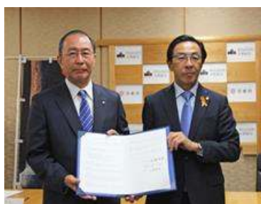
京都府と連携協定締結