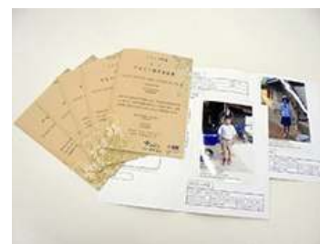
タイの中学生からの近況報告