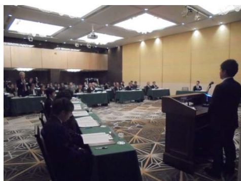
奨学生交流会の様子

また、奨学生が一堂に会し、研究報告を通じて交流を行う「奨学生交流会」を2019年2月に開催しました。