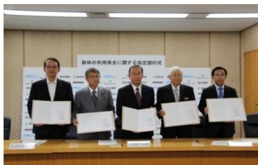
京都府で「森林の利用保全に関する協定」締結