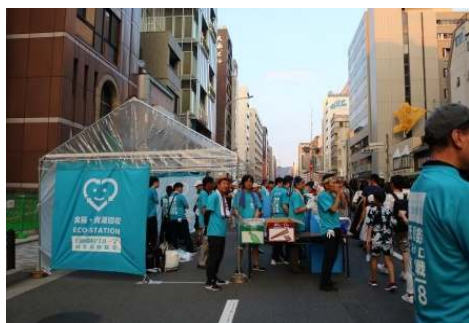
祇園祭ごみゼロ大作戦