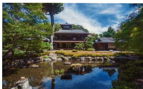
旧三井家下鴨別邸