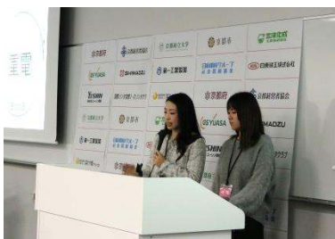
高校生のためのフューチャーフォーラム