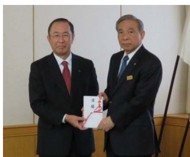
群馬県との「県有林整備パートナー事業実施協定」に基づいて寄付