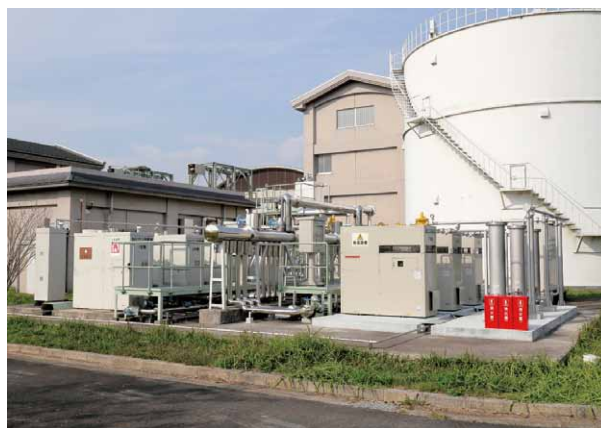
図5 消化ガス発電設備